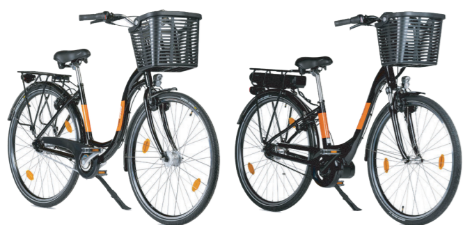
monbicloo Classique AVEC OU SANS ASSISTANCE ÉLECTRIQUE

Avec monbicloo Nantes Métropole adoptez le vélo qui vous correspond