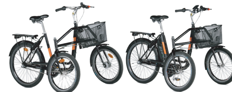
monbicloo Équilibre AVEC OU SANS ASSISTANCE ÉLECTRIQUE

Équipé de deux roues à l'avant, ce tricycle urbain est le meilleur allié pour des trajets à vélo en toute stabilité.