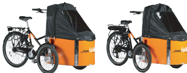
monbicloo Cargo AVEC OU SANS ASSISTANCE ÉLECTRIQUE

Fidèle compagnon des familles, ce vélo permet de transporter jusqu'à 2 enfants de 0 à 10 ans, protégés de la pluie.