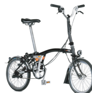
monbicloo Pliant VÉLO MÉCANIQUE

Facile à plier et déplier, c'est le vélo idéal pour les trajets multimodaux et les petits espaces.